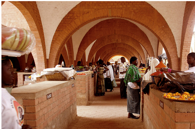
Marché central de Koudougou, Burkina-Faso