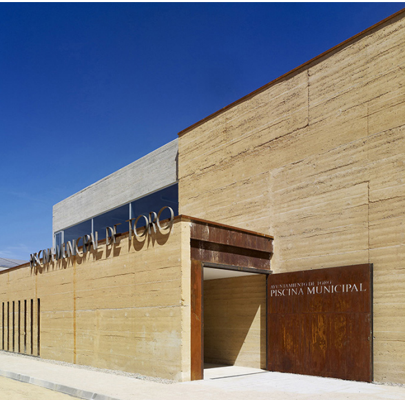
Piscine municipale, Toro, Espagne