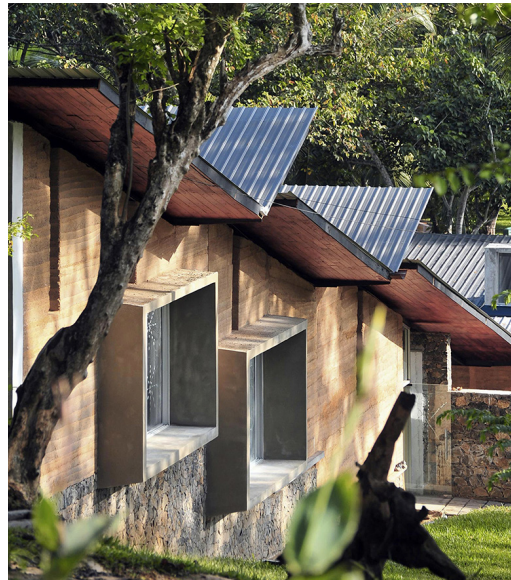
Bibliothèque communautaire, Ampebussa, Sri Lanka