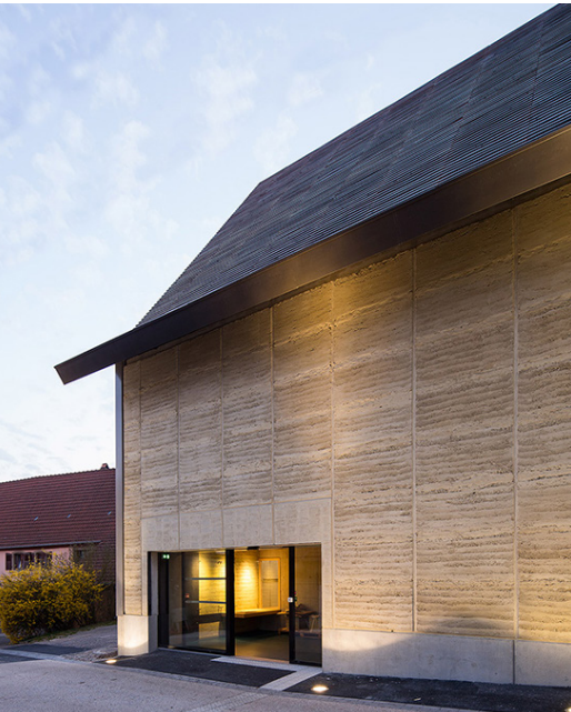
Centre d'interprétation du patrimoine archéologique, Dehlingen, France