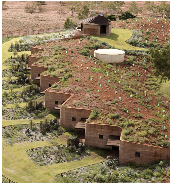
Maisons pour bergers, Pilbara, Australie