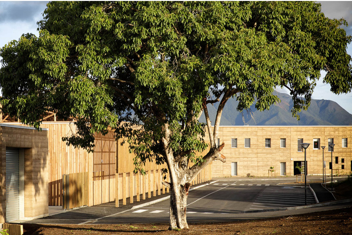
Collège Païamboué, Koné, Nouvelle-Calédonie