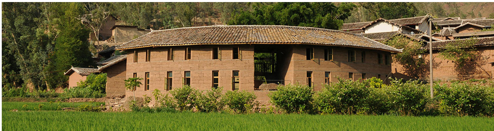
Reconstruction d'un village après séisme, Ma'anqiao, Chine