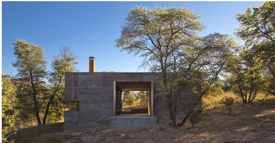
Maison Caldera, San Rafael Valley, Etats-Unis